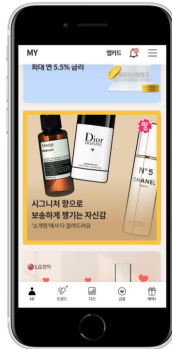
메인 피드 배너

광고 반응률이 높아, 아웃랜딩을 활용한 구매전환에 효과적 (*광고 피로도로 인한 발송 건수 미달성 시, 2~3일 이내 추가 발송)