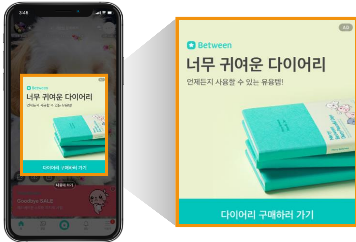
전면 팝업배너 노출 예시

1일 단독 팝업 노출로 유저 주목도가 매우 높으며, 전면배너로 노출되어 브랜드 인지 및 유입 확보에 효과적